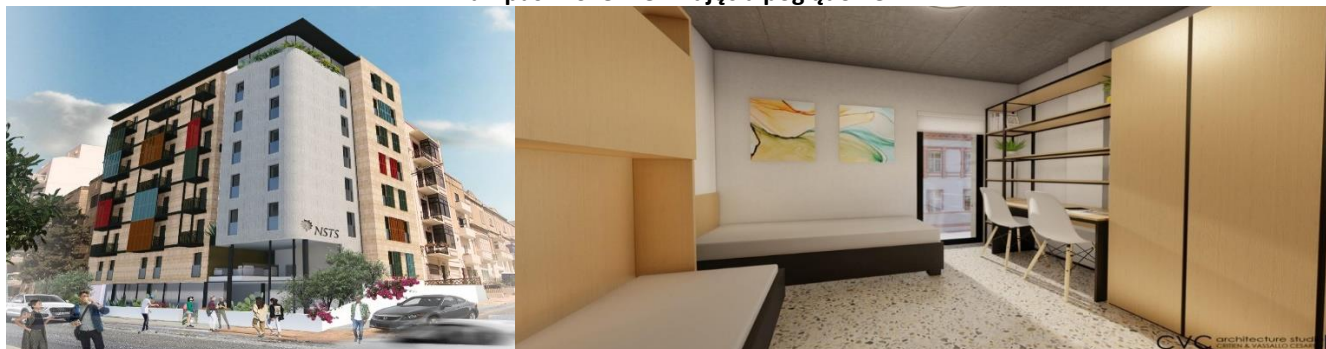
Kampus w Sliemie – zdjęcia poglądowe

OPIEKA: Podczas pobytu młodzież znajduje się pod całodobową opieką zagranicznej kadry. Polski opiekun w niektórych terminach będzie na kampusie w Sliemie, a w niektórych w Gzira. Będzie w stałym kontakcie ze wszystkimi uczestnikami.