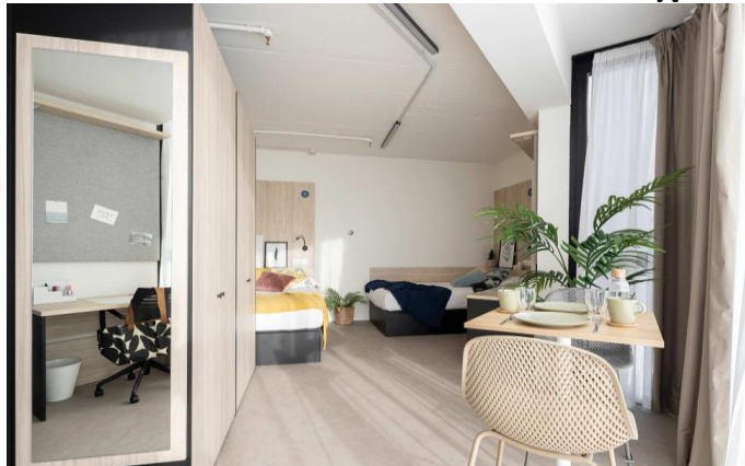
Zdjęcia rezydencji City